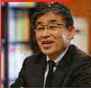
宮崎市副市長 永山英也氏